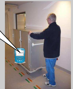
PTrans - Transportmanagement im Krankenhaus

Von: Station B15 Nach: DLZ-Sekretariat Beginn Soll: 15:00 Transportart: PatAkten Patient: Mustermann Bemerkung: